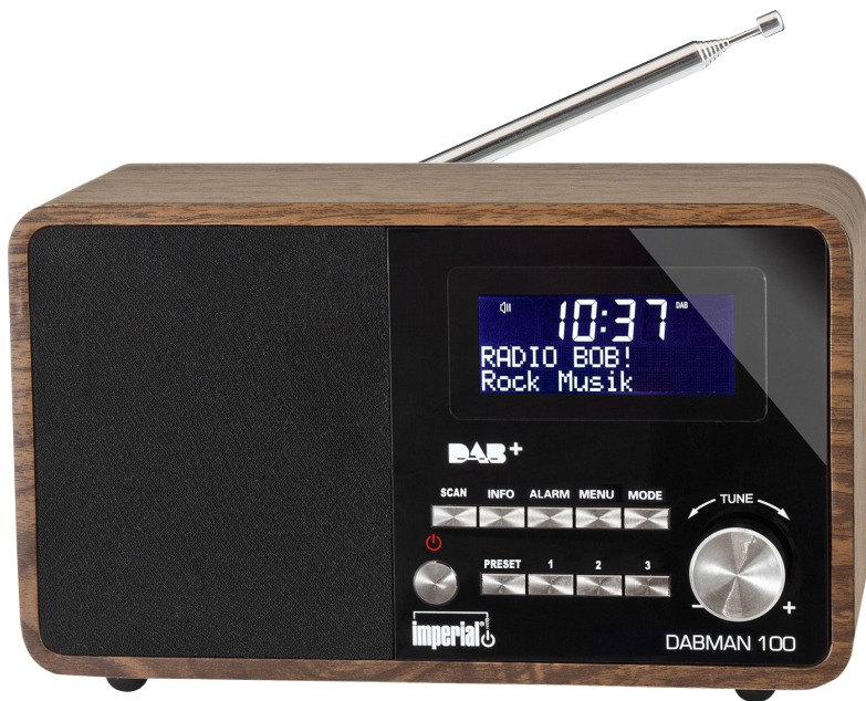
Mod. DABMAN 100