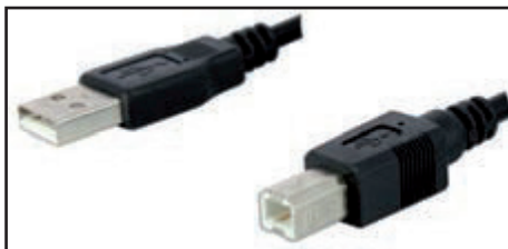
USB Kabel (zur Verbindung mit PC)