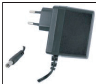
AC/DC Netzteil +5V / 4A

Verbinden Sie Ihr DTV Rack oder Ihre Kompakt-Kopfstele NICHT mit Ihrem Computer, bevor Sie DTVIface vollständig installiert haben.